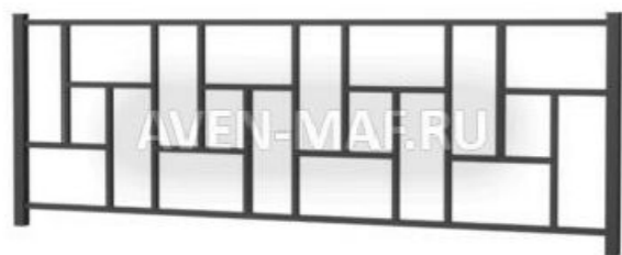
1) Забор БТО 22