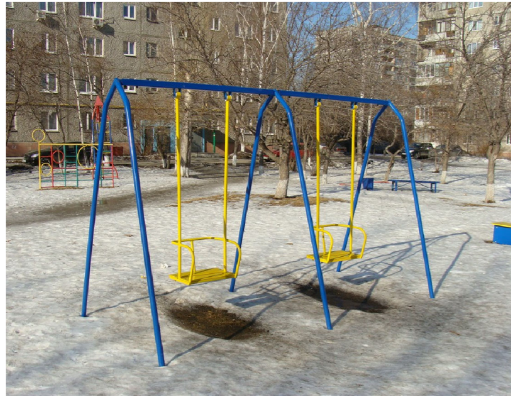
9) Парковые качели «Лодочка стандарт» КДО 11