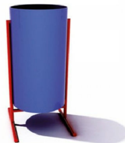
3) Урна БТО 66