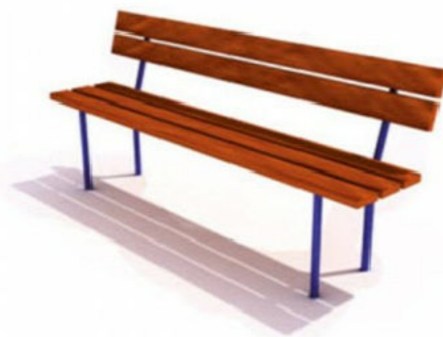
2) Скамья БТС 03