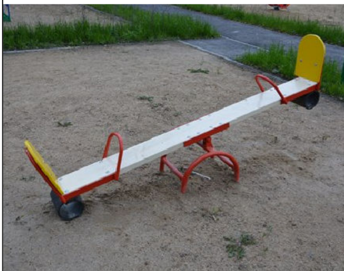
5) Качели Балансир «Деревянные» КДО 16