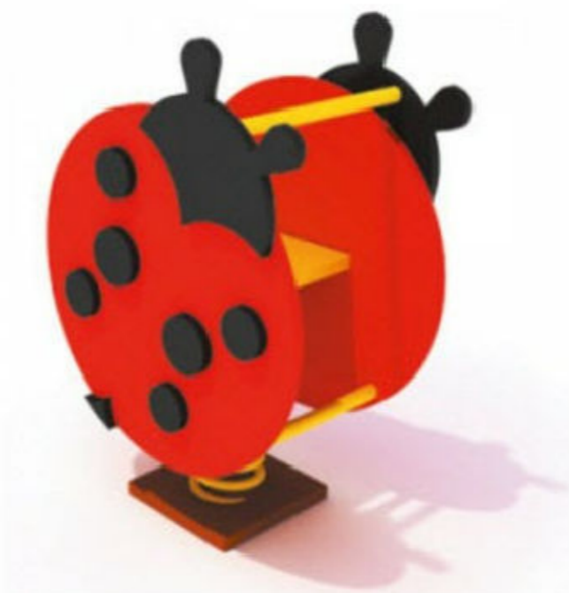
6) Качели на пружине «Божья коровка» КДО 39