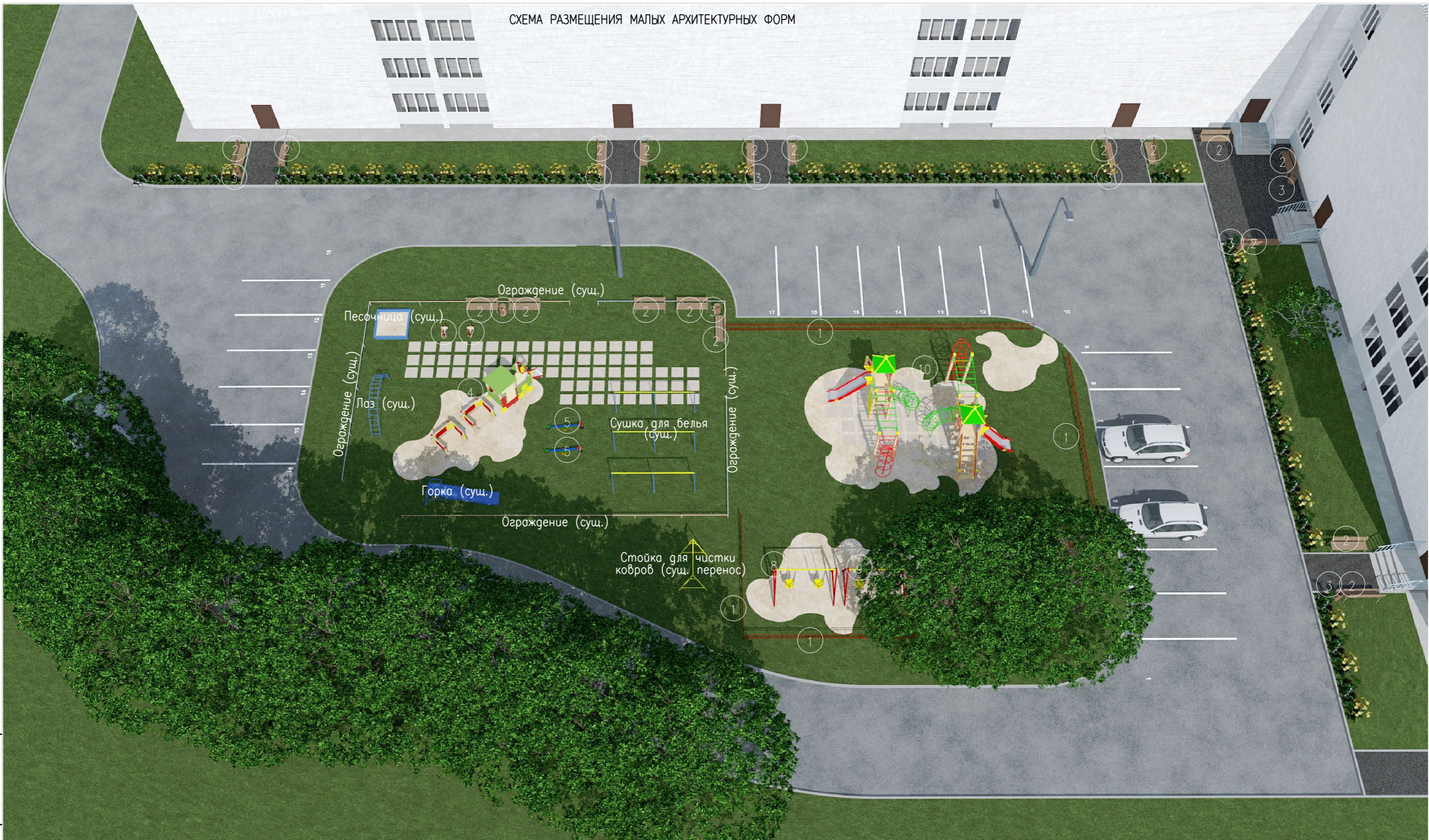
СХЕМА РАЗМЕЩЕНИЯ МАЛЫХ АРХИТЕКТУРНЫХ ФОРМ