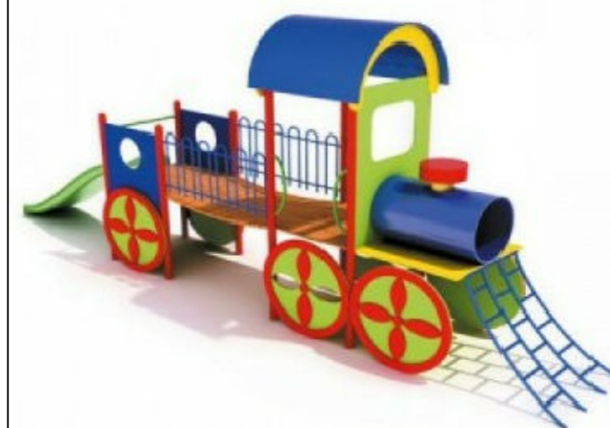
4) Детский игровой комплекс "Паровоз" ДИК 064